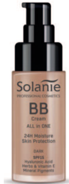
DARK 50 ml Art.-Nr. SO10924