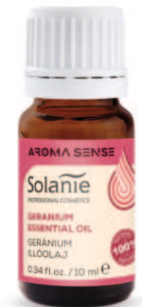
GERANIUM-ÖL 10 ml Art.-Nr. SO23047

Raumduft: 3-4 Tropfen, Reduzierung der Symptome von Hautdefekten: 1-2 Tropfen in 1 EL Avocado- oder Jojobaöl und in die Haut einmassieren, Fußbad: 1-2 Tropfen mit 1 EL Sahne oder Avocado-Öl mischen und zu 2-3 Litern Wasser geben- Sauna: 2-3 Tropfen