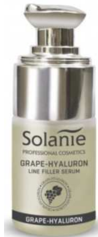
GRAPE HYALURON LINE FILLER SERUM 15 ml Art.-Nr. SO21700 30 ml Art.-Nr. SO31700

Hauptinhaltsstoffe: Vitamin A, Vitamin B3 (Niacinamid), Vitamin B5, Vitamin C, Vitamin E, Hyaluronsäure, blaues und weißes Lotusblüten-Aromawasser, Bio-Traubenwasser, Panthenol, TO Complex®.