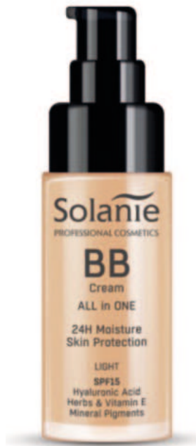
LIGHT 30 ml Art.-Nr. SO10922