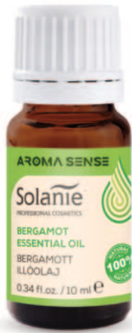
BERGAMOTTE-ÖL 10 ml Art.-Nr. SO23044

Sein leichtes, frisches, fruchtiges, leicht blumiges ätherisches Öl ist erhebend und ermutigend, hilft Angst und Stress abzubauen, gibt Vertrauen. Seine stimmungsaufhellende strahlt Herz und Seele an, lindert Gefühle von Wut und Frustration. Aufgrund seiner adstringierenden und reinigenden Wirkung kann es sowohl zum Ausgleich der Talgproduktion als auch zur Mundhygiene eingesetzt werden.