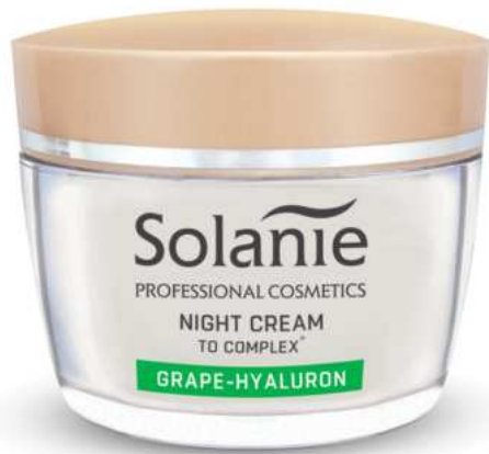
GRAPE HYALURON NIGHT CREAM mit Tokaj-Oleo-Komplex 50 ml Art.-Nr. SO11706

Regenerierende, faltenglättende und feuchtigkeitsspendende Trauben-Hyaluron-Nachtcreme, reich an natürlichen Inhaltsstoffen für Gesicht, Hals und Dekolleté. Der spezielle TO Complex® neutralisiert freie Radikale, die die Hautzellen schädigen, und schützt sie durch seine hervorragende antioxidative Wirkung vor Zellschäden.