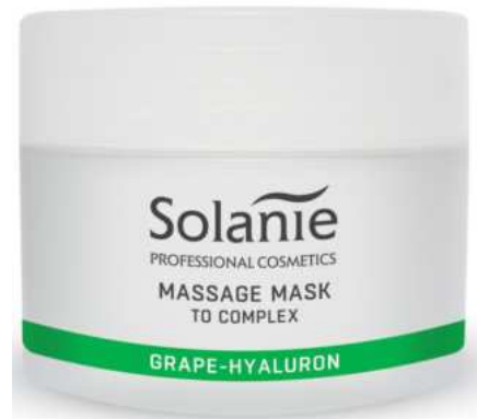
GRAPE HYALURON MASSAGE MASK 100 ml Art.-Nr. SO21708

Hauptinhaltsstoffe: Allantoin, Vitamin B3 (Niacinamid), Hyaluronsäure, Bio-Traubenwasser, Panthenol