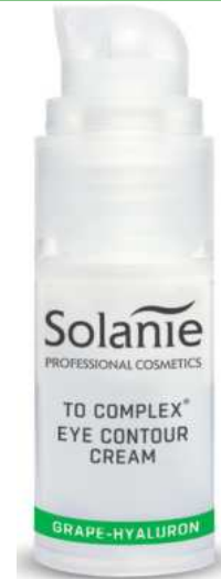
EYE CONTOUR CREAM mit Tokaj-Oleo-Komplex 15 ml Art.-Nr. SO11707 50 ml Art.-Nr. SO21707

Hauptinhaltsstoffe: Vitamin A, Arganöl, Vitamin B3 (Niacinamid), Vitamin B5, Ascorbinsäure, Vitamin E, Hyaluronsäure, Kakao-butter, Aromatisches Wasser mit blauer und weißer Lotusblume, Magnesium PCA, Bio-Traubenwasser, PCA (NMF-Komponente), Squalan