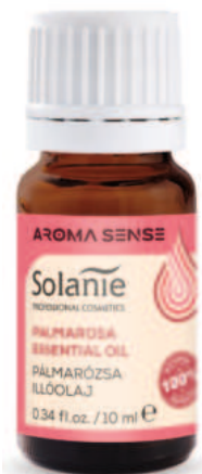
PALMROSEN-ÖL 10 ml Art.-Nr. SO23046

Raumduft: 3 Tropfen, Badewanne: 6-8 Tropfen mit 1 TL Avocado-Öl/Sahne/Honig mischen, Gesichts-/Körper: 1-2 Tropfen in 1 EL Avocado- oder Jojobaöl sanft in die Haut einmassieren. Sauna: 2 Tropfen