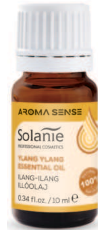
YLANG-YLANG 10 ml Art.-Nr. SO23045

Raumduft: 3-8 Tropfen, Trockene Inhalation: 1-2 Tropfen, Aroma-Bad: 6-8 Tropfen mit 1 TL Avocado-Öl, Sahne oder Honig mischen, Haare: bei fettigem Haar und Schuppen 2-4 Tropfen mit 1 EL Aloe Vera Gel mischen, in die Kopfhaut einmassieren, 15-20 Minuten einwirken lassen und ausspülen. Mundwasser: 1 Teelöffel 70% Alkohol mit 1-2 Tropfen ätherisches Öl in einem Glas mischen, 2 EL lauwarmes Wasser zugeben und umrühren.