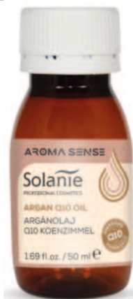
AROMA Q10 OIL AROMA SENSE 50 ml Art.-Nr. SO23065

Die kombinierte Wirkung von Argan-Öl und Q10 nährt, energetisiert und verwöhnt die Haut mit 100% natürlichen Inhaltsstoffen. Das Öl kann entweder allein oder gemischt mit einer Creme oder einem Massageöl verwendet werden, um eine maximale Hautpflege zu erreichen. Das Öl verbessert die Hydratation der Haut und verhindert das Austrocknen der Haut. Für Gesicht und Körper sowie für die Haarpflege geeignet.