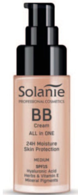
MEDIUM 30 ml Art.-Nr. SO10923