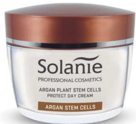
ARGAN STEM CELLS PROTECT DAY CREAM 50 ml Art.-Nr. SO11601 100 ml Art.-Nr. SO21601

Hauptinhaltsstoffe: Arganöl, Sonnenblumenöl, Olivenöl, Coenzym Q10